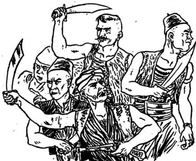
Τούς καρτερούν με γυμνά σταθιά...