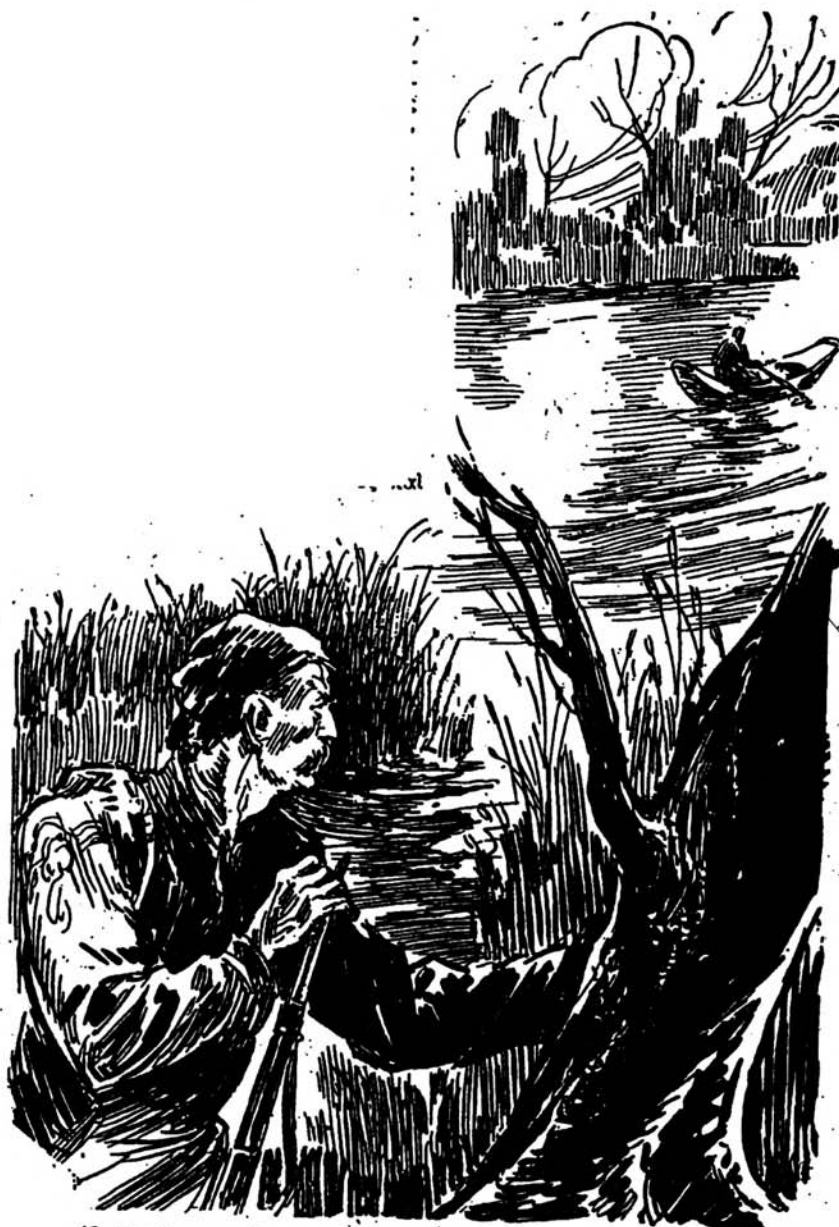
Ὁ κυνηγὸς μισοκρῶνεται στὰ ρεῖμα τῆς λιμνοθάλασσας ὡς δισταχτικὸς.

Τό πρῶτο σχέδιο δημοσιεύτηκε στό «Μικρό Ἑλληνόπουλο». Τά ὑπόλοιπα στό περ. «Παιδόπολις – τό σπίτι του παιδιοῦ».